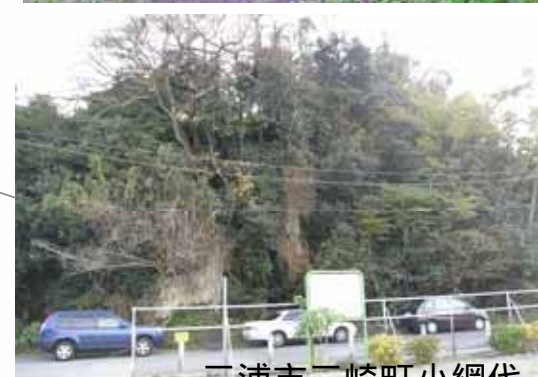
三浦市三崎町小網代