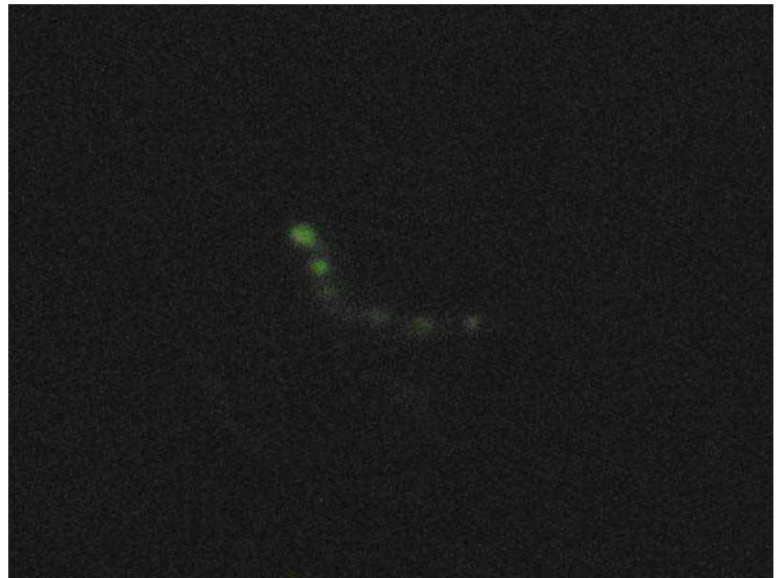
ホタルミミズの発光

ミミズ類には数メートルもある大きなものや、極寒で暮らすものなど様々な種類がある。そして発光するミミズも数種あるが、日本で見ることができる陸生の発光するミミズとしてはホタルミミズ Microsculex phosphoreus (Dugès, 1837) が知られている。