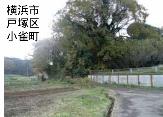
横浜市 戸塚区 小雀町